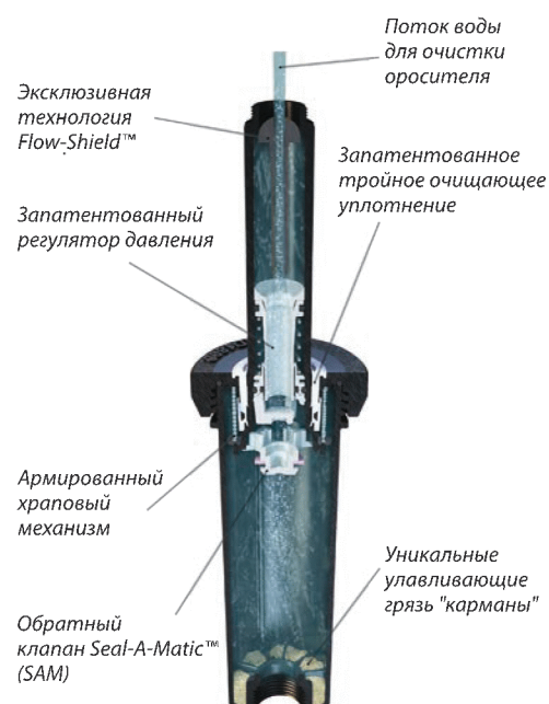
Эксклюзивная технология Flow-Shield™