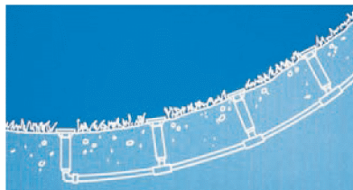
С антидренажным клапаном SAM