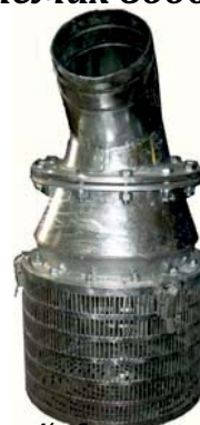
Водозаборный фильтр с обратным клапаном и выходом - тип ниппель