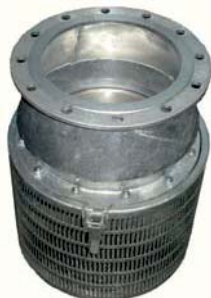
Водозаборный фильтр с обратным клапаном

Предназначен для фильтрации поливной воды, подающейся к насосу, оборудован сеткой которая обеспечивает устранение механических примесей (камешков, листьев и прочих), а также укомплектован обратным клапаном для предотвращения обратного движения жидкости в системах водоснабжения, пожаротушения, полива и т.д.