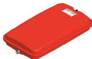
Disegno / Чертёж 539/L