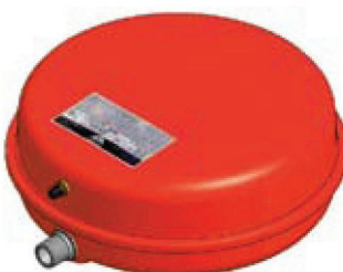
Disegno / Чертёж 541/L