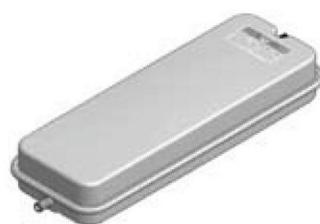
Disegno / Чертёж 537/XL