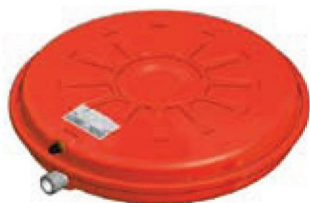
Disegno / Чертёж 531/L