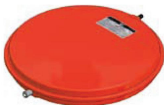
Disegno / Чертёж 522/L