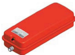
Disegno / Чертёж 537/L