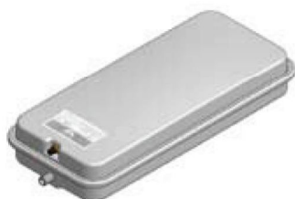
Disegno / Чертёж 518