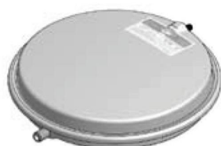
Disegno / Чертёж 533