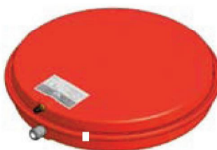
Disegno / Чертёж 521/L