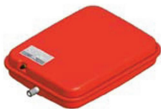
Disegno / Чертёж P637/L